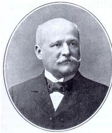
Governador Paes de Carvalho

a) o Decreto nº 721 , extinguiu as duas escolas integrais do sexo masculino, as duas escolas integrais do sexo feminino, ambas no centro da cidade, e mais a escola elementar mista do bairro da Luanda e a escola elementar do sexo masculino do Arapiry, e, ato contínuo, criou, como sucedâneas, 1 escola complementar para o sexo masculino, 1 escola complementar para o sexo feminino, 2 escolas elementares para o sexo masculino e